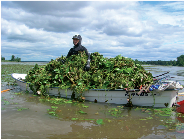
Försök med bekämpning av Sjögull i Galten i Kungsörs kommun.